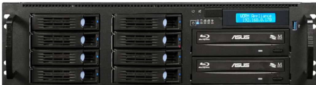
StorEasy® WormAppliance Enterprise (Basiseinheit)

Die StorEasy® WormAppliance Enterprise ist eine kompakte Archivstation mit integrierter Kopfeinheit, die die Kontrollfunktionen für Datenbereitstellung, -fluss, -aufbereitung, Medienproduktion und Administration beinhaltet.